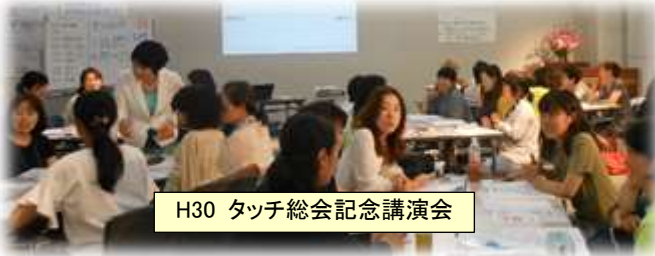
H30 タッチ総会記念講演会

タッチは産科でのベビーマッサージからお世話になってきました。最初は子供との時間が少しでも充実したものにできればと思って参加させて頂いてました。先生のお話を聞いているうちに自分の子育てでの知識の乏しさ、偏見、漠然とした将来の不安もあり多岐にわたる講座を受講させて頂きました。確実な知識にならなくても、私はその時その時の悩みや不安、子育てへの解決のヒントを貰ってきました。今では子供と過ごす限られた時間を少しずつ豊かなものに変え、子供に負けないように日々私も成長していこうと思っております。感謝しています。(M.K.)