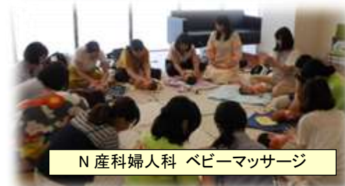
N 産科婦人科 ベビーマッサージ

初めての産後、慣れない子育てに手探りの毎日が本当に辛かったのを覚えています。しかし、タッチに出会い、学び、実践していく中で、沢山の自信と勇気を頂きました。今でも私の支えとして寄り添ってくれています。本当に出会えて良かったと思います。(M.T.)