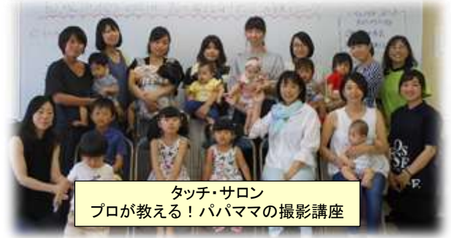
タッチ・サロン プロが教える！パパママの撮影講座