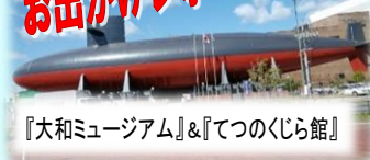
『大和ミュージアム』&『てつのくじら館』

先日、5歳の息子と4歳の甥っ子を連れて行ってきました、呉の『大和ミュージアム』と『てつのくじら館』！男の子2人は、「大きいねえ、すごいねえ！」と言いながら、こっちへウロウロ、あっちへウロウロ。大和ミュージアムの中では船や飛行機の模型を食い入るようにじっくり眺めては大はしゃぎ！呉の街の様子のパノラマも面白そうに眺めていました。てつのくじら館の潜水艦内では、ドキドキしながら操縦席に座って写真をパチリ♪楽しんだ後は、カフェでほっと一息。母はそこにろきさんの珈琲をおいしくいただいて帰りました♪ (はるくんママ)